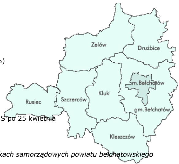
Tabela 1. Rejestrowane zmiany w liczbie bezrobotnych w jednostkach samorządowych powiatu bełchatowskiego wg stanu na koniec marca 2019 r. i 2020 r.

stopa bezrobocia za marzec 2020 r. opublikowana będzie przez GUS po 25 kwietnia